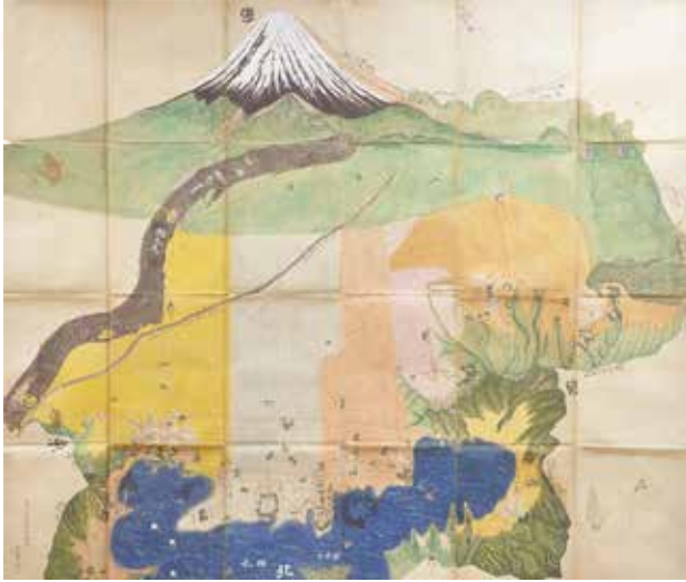
《大嵐村外六ヶ村絵図》