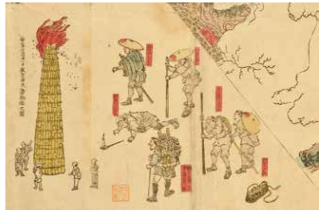
《富士山真形平絵図》(部分拡大)

富士山真形平絵図は、起こし立てると富士山の立体図に変わる仕掛けがあります。当センターではこの立体絵図のミニチュアを作るワークショップを開催します。