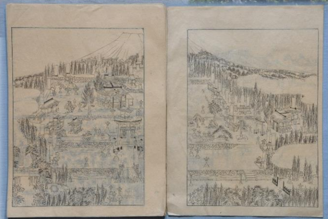
「富士山明細図草稿」