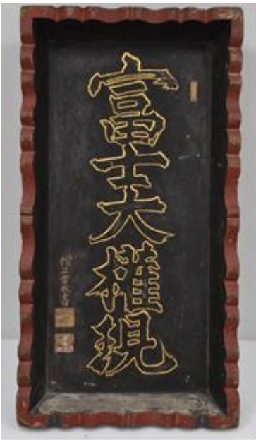
鳥居額「富士大権現」 〔浅間神社〕（忍野村忍草）

鳥居には額が奉納されます。浅間神社三社の鳥居の額字や額を比較すると、北口本宮富士浅間神社のものは突出して大きいことがわかります。本企画展ではこれらを展示し、皆様に紹介します。