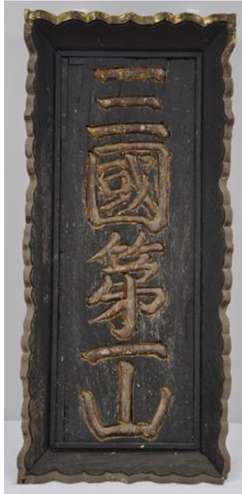
鳥居額「三国第一山」 〔富士浅間神社〕（富士吉田市新倉）