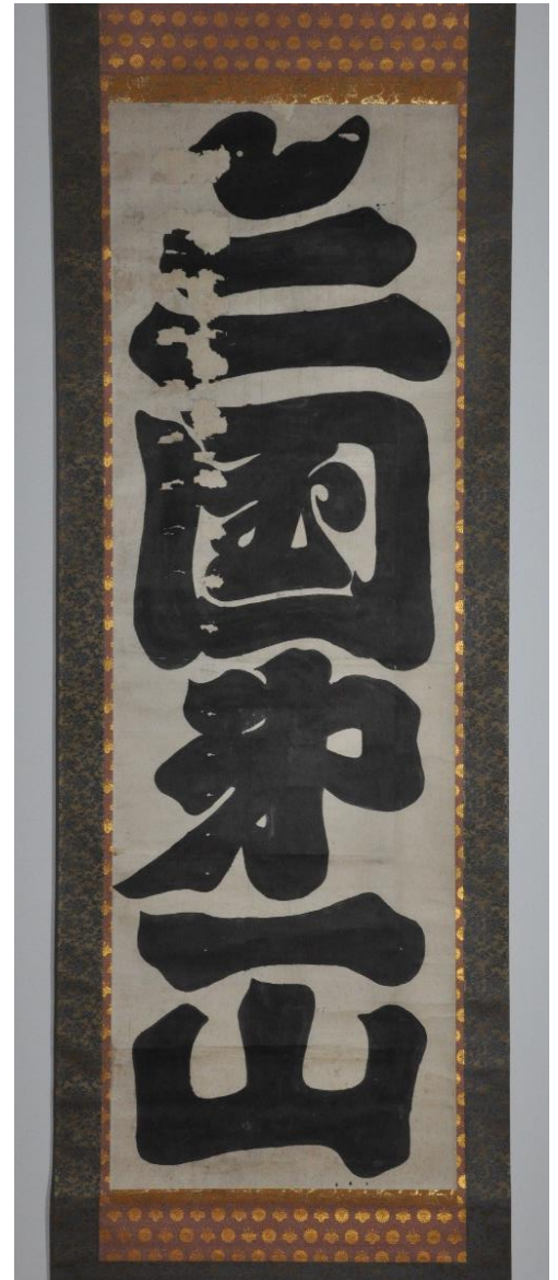
額字「三国第一山」 〔北口本宮富士浅間神社〕